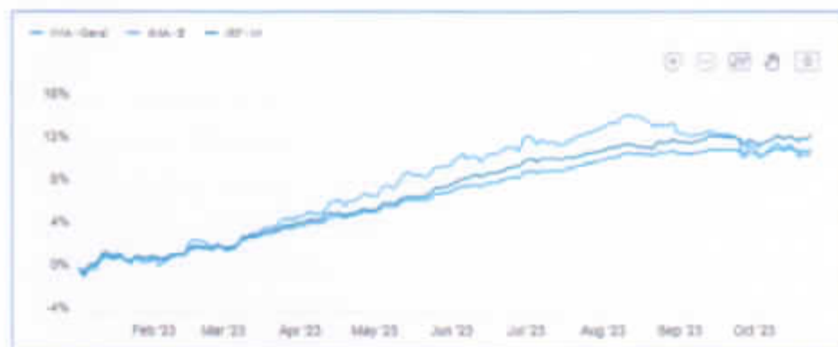
Comportamento dos índices IMA até 24 de outubro de 2023.

na ETTJ a partir de agosto, também com reflexos importantes nos índices IMA. A conjunção de baixa inflação com alta nos prêmios de risco dos títulos públicos prejudicou especialmente os índices pós-fixados a partir de agosto.