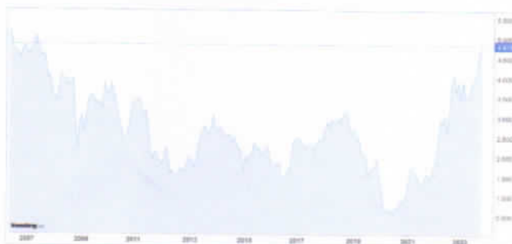
Taxa de juros dos títulos públicos com vencimentos em 10 anos.

Ao passo que o Federal Reserve elevou os juros de curto prazo, as taxas de longo prazo, representadas pelos títulos norte-americanos com vencimento em 10 anos, subiram para máximas históricas, atingindo níveis também semelhantes aos de 2007 (gráfico ilustrativo a seguir). Este comportamento significou uma redução de liquidez generalizada no mercado internacional, pressionando as taxas de câmbio e os prêmios de risco dos títulos públicos das economias periféricas, como o Brasil.